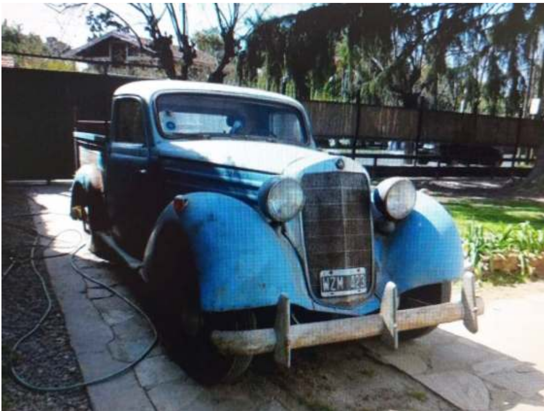
Foto de antes de restaurarse

Por supuesto La Mercedita, como le decimos, es parte de la familia y esperamos que ahí continúe por el paso del tiempo.